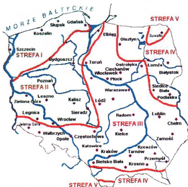
Rys. 1 Strefy klimatyczne Polski i temperatury obliczeniowe (źródło: https://www.hvacr.pl/ )

Położenie obiektu, w którym planowany jest montaż, na mapie ma wpływ na pracę instalacji oraz na dobór mocy projektowanego kotła. W zależności od współrzędnych geograficznych rozbieżności w temperaturach projektowych mogą mieć znaczącą wartość i wpływ na zapotrzebowane na ciepło w budynku. W skali kraju ilustruje to poniższa mapa (Rys.1).